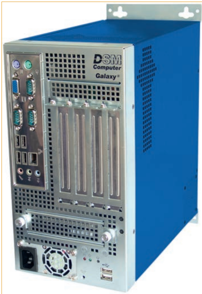
Bild 3: Der Schaltschrankrechner »Galaxy G1-A« von DSM bietet eine hohe Rechenleistung und eine breite Palette an Schnittstellen

Datensicherheit, beispielsweise durch Datenverschlüsselung, im Vordergrund. Ein weiterer kritischer Punkt des Cloud-Konzepts ist der Schutz des firmeneigenen Know-hows vor dem Zugriff nicht autorisierter Personen. Neben den sicherheitskritischen Prozessabläufen gibt es jedoch eine Reihe von Anwendungen, die sich für Cloud-Computing bestens eignen. Gegenwärtig werden in der Automatisierungsindustrie überwiegend die dezentrale Datenerfassung und die Prozessvisualisierung abgedeckt. Zukünftig ist auch die Speicherung von Daten und das Bereitstellen beziehungsweise Verteilen von Applikationen denkbar. Auch im Fertigungsumfeld, etwa bei der Auftragsabwicklung und Materialbeschaffung, wird die Cloud in der nächsten Zeit eine große Rolle spielen. Maschinen- und Anlagenbauer sowie deren Kunden profitieren darüber hinaus von einer Internet-ba-