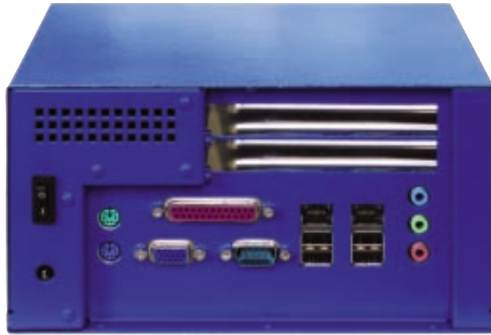
Als zentrale Kommunikationsstelle in der Fertigung können Embedded Systeme nicht genug Schnittstellen haben

Anwender bzw. Applikationen mit Hang zum Extremen dürften die Option schätzen, die Rechner für den erweiterten Temperaturbereich von -10 bis + 60 °C auszuliegen. Auf Grund der ausgeglichenen Wärmeverteilung und -abführung und der stromsparenden Komponenten lässt sich das mit wenig Aufwand und damit Kosten realisieren. Aber auch die Standard-Ausführung (0 bis 50 °C) profitiert von den thermischen Designvorkehrungen. Die derzeitigen Prozessorausführungen beginnen mit zwei Pentium M Prozessoren (1,1 GHz LV und 1,6 GHz). Alternativ stehen für weniger rechenintensive Anwendungen auch Celeron M Prozessoren zur Verfügung. Auf Grund ihrer vielfältigen Schnittstellen können die NanoServer in den unterschiedlichsten Anwendungen und Einsatzorten betrieben werden. Ein mögliches Szenario ist die Applikation als Prozessdatenserver in einer Fertigungszelle. Ausgangspunkt ist dabei die Anbindung der Zelle an den übergeordneten Fertigungsrechner über eine der beiden integrierten LAN-Schnittstellen. Über die zweite Ethernet-Schnittstelle wird ein Teil der Komponenten der Zelle mit dem PC verbunden. Der PCI-Steckplatz wurde für die Integration einer Profibus-Anschaltung verwendet, so dass sich weitere Sensorkomponenten anschließen lassen. Die Einbindung der Prozessdaten in